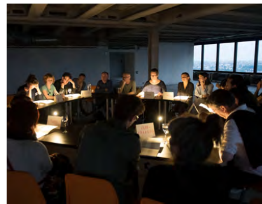
Your Word In My Mouth

In zahlreichen Gesprächen mit Theater- und Sozialwissenschaftler*innen, Theaterpädagog*innen, Künstler*innen und Theaterpraktiker*innen der Bürgerbühnen hinterfragten Hannes Langer und Katja Münster im Sommer 2021 die Institutionalisierung partizipativer Theaterkunst an deutschsprachigen Stadt- und Staatstheatern. Im daraus entstehenden Buch, das im Frühjahr 2023 im Beltz-Juventa Verlag erscheinen wird, geht es unter anderem um die Frage, ob sich partizipative Arbeitsweisen mit der inzwischen starken Institutionalisierung ebenjener Theaterformate vereinbaren lässt. Bei einem digitalen Frühstück stellt Hannes Langer erste Perspektiven aus ihren Interviews und Gesprächen vor.