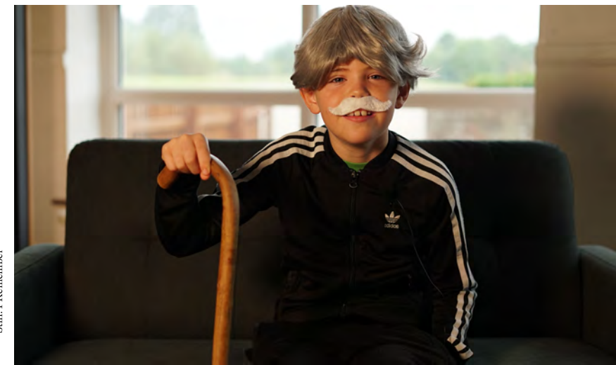
Still: I Remember