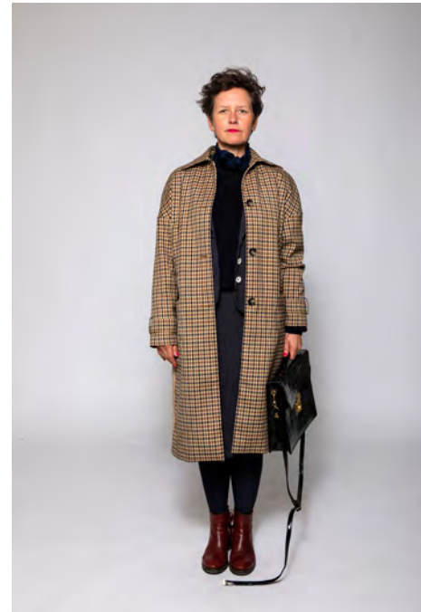
Die Bürgermeisterin

Nach dem Motto "Show, don't tell" wurden die COMMON PLACES - Tage für Partizipation und Theater kuratiert. Geredet werden muss am Anfang trotzdem: Das Festival-Team begrüßt aus dem neu eingerichteten Studio, stellt sich vor und stimmt ein auf drei Tage voller Diskussion und Input. Wir freuen uns über ein Grußwort von Petra Olschowski, Staatssekretärin im Ministerium für Wissenschaft, Forschung und Kunst Baden-Württemberg. Bevor wir in den kommenden Tagen in interaktive Zoom-Räume wechseln, lässt sich das Donnerstagsprogramm bequem im Stream genießen. Zwangloses Einschalten willkommen!