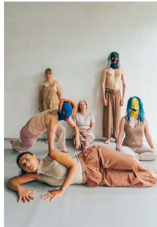
Shifting Faces.

Wie Tanz für jeden zu einer Form werden kann sich auszudrücken und wie künstlerische Qualität jenseits von Technik und normativer Körperlichkeit aussehen kann, darüber unterhalten sich im Nachgang zu Shifting Faces drei Vertreter*innen aus freien und festen Companies in Deutschland, Österreich und den Niederlanden.