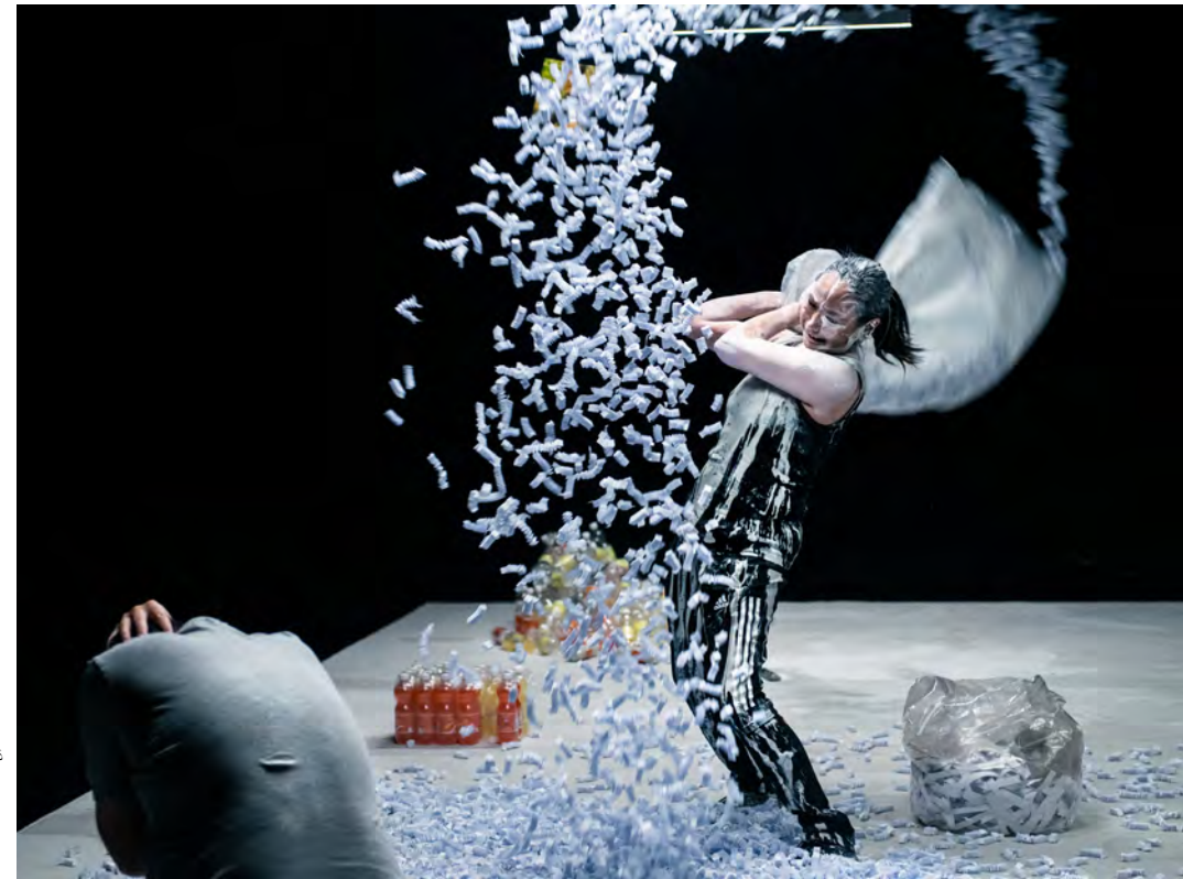
Stille Slag

Eine Produktion des Østerbro Teater Kopenhagen.